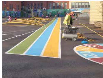
شکل ۱۲. ایجاد پستی و بلندی در بخش‌هایی از حیات