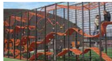
شکل ۲. امکان صخره‌نوردی روی دیوارهای خارجی این دالان‌ها

اما چه موانع و ابزارهایی را باید در این نوع مسیرها پیش‌بینی کرد؟ پاسخ این سؤال کاملاً باز و مبتنی بر خلاقیت شماست. مواردی مانند استفاده از سطوح شیب‌دار، پستی و بلندی، شبکه طنابی، دالان‌های شفاف در ترازهای ارتفاعی گوناگون (شکل ۲)، صخره مصنوعی، استخر توپ، نردبان طنابی، لاستیک خودرو جهت عبور از داخل و یا روی آن و بسیاری از ایده‌ها و ابزارهای خلاقانه‌ای که متناسب با موقعیت‌های مدرسه شما می‌توان به کار بست.