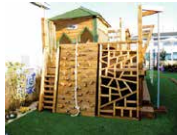
شکل ۳. راه‌های منتهی به بوفه مدرسه

البته روشن است که این موانع نباید خطرآفرین باشند. همچنین باید جذابیت و دعوت‌کنندگی لازم را داشته باشند تا بچه‌ها در بیشتر مواقع، به جای راه دسترسی معمول و هموار، مسیر مشوق تحرک به وسیله این موانع را انتخاب کنند.