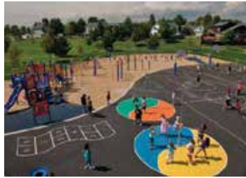
شکل ۱۱. عرصه‌بندی حیات مدرسه به بخش‌های گوناگون