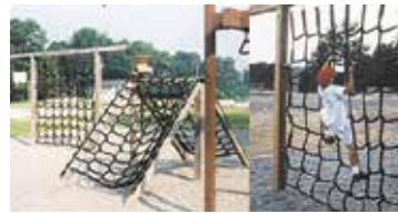
شکل ۴. انواع شبکه طنابی