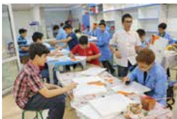
شکل ۱. فضای یادگیری پرتحرک

مکانی خود را مکرراً تغییر دهند. چنین شرایطی خودبه‌خود مانع سکون طولانی افراد می‌گردد.