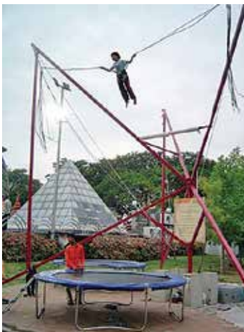
شکل ۱۳. قرار دادن تجهیزات پارکی مفرح مانند ترامپولین در گوشه و کنار حیات