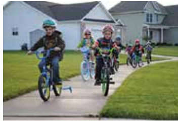
شکل ۹. وجود پیست دوچرخه در محوطه مدرسه

خوشبختانه مدتی است که طرحی به نام «حیات پویا» در برخی مدارس به اجرا درآمده است. هرچند خروجی این طرح نباید محدود به خط‌کشی‌ها و نقوش جذاب در کف حیات باشد، بلکه ظرفیت حیات مدرسه برای تشویق تحرک و حتی یادگیری بچه‌ها به مراتب بیشتر از این‌ها است. حیات یک مدرسه باید عرصه‌بندی شود و مانند یک پارک، مجهز به فضای سبز، پستی و بلندی، وسایل بازی و ورزشی گروهی و فردی، بتواند با یک تنوع فضایی بالا، بسیاری از امکانات مشوق تحرک و نشاط را در خود جای دهد.