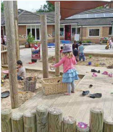
شکل ۱۴. پیش‌بینی محیط بازی‌های مختلف با عناصر طبیعی و ساده

باز هم مناسب‌تر دیدیم تا برخی ایده‌های مرتبط با این بحث را به شکل مصور با هم مرور کنیم: