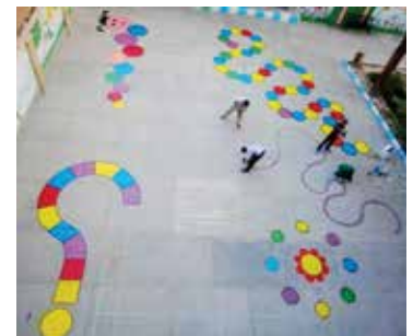
شکل ۸. طرح حیات پویا در مدارس ایران

باز هم مناسب‌تر دیدیم تا برخی ایده‌های مرتبط با این بحث را به شکل مصور با هم مرور کنیم: