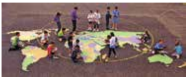
شکل ۱۰. نقوش کف حیات و امکان یادگیری توأم با تحرک

در هر صورت می‌توان گفت مدرسی که نه فقط زنگ و ورزش آن‌ها، بلکه متن فضاها و فعالیت‌های آن‌ها، نیز موقعیت‌هایی مناسب برای تحرک، جست و خیر و نشاط جسمی و روحی بچه‌هاست، مدرسی جذاب و دوست‌داشتنی هستند. راهکارهای زیادی با هزینه نه چندان زیاد وجود دارد که می‌تواند موجب نشاط و پویایی مدرسه باشد. فقط کافی است با این نگاه در فضاهای مدرسه خود قدم بزنید و گوشه و کنار مدرسه را بررسی کنید، آن‌گاه خواهید دید که انواع راه‌های خلاقانه به ذهنتان ورود می‌یابد. با کمترین هزینه و بیشترین تأثیر.