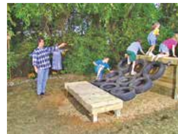
شکل ۵. ابزار ساده برای تحرک بیشتر