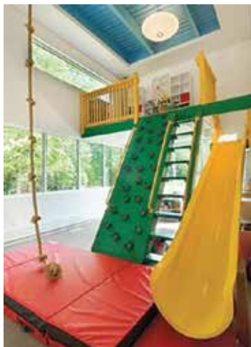
شکل ۷. دسترسی متنوع به طبقه بالاتر